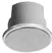
冲孔金属面板 WS-4600GN 3w