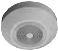
树脂面板 WS-4430N 3w