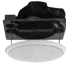
冲孔金属面板 WS-4991GN 3w